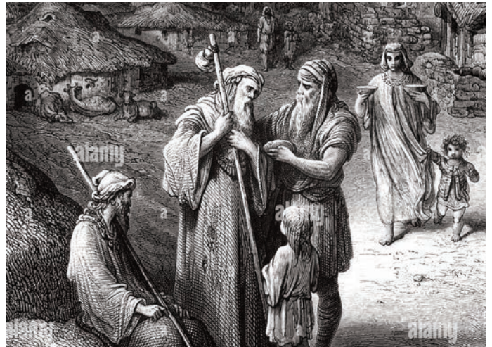
Peregrinos medievales en Tierra Santa. Grabado en madera de Gustavo Dore

Aunque estos primeros cristianos se movían por motivos muy diferentes a los del peregrino judío, ya que se interesaban por los lugares testigos de la vida y muerte de Cristo, sobre todo su sepulcro, dándose la paradoja que la tumba más deseada de la cristiandad